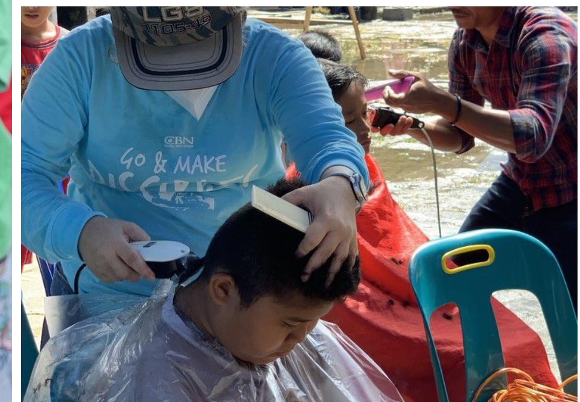
Pelayanan Potong Rambut Gratis