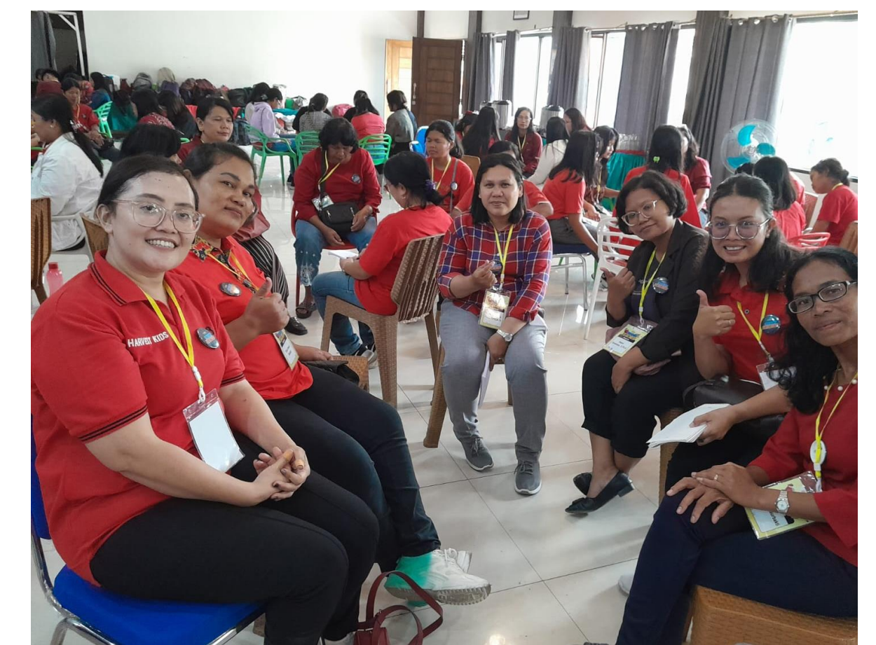
Suasana di ret-ret Pelayan Anak “Superteacher”