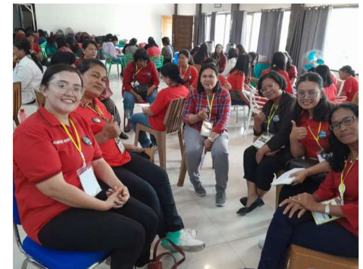
Suasana di ret-ret Pelayan Anak “Superteacher”