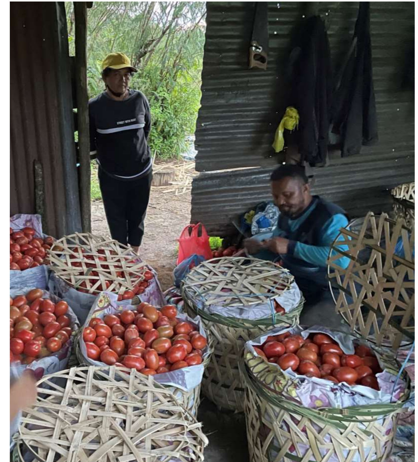
Hasil Panen Tomat dari komunitas GPMI Eirene