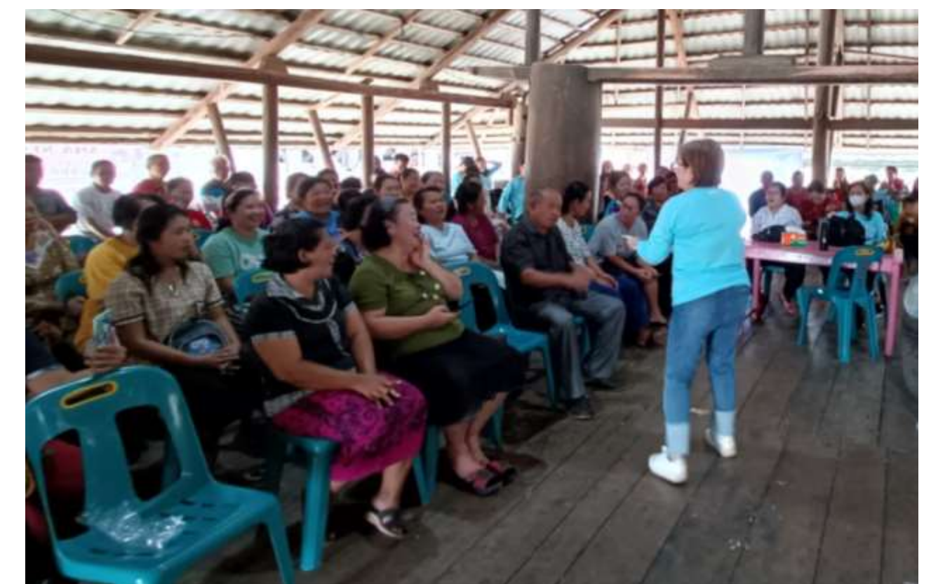
Penyuluhan parenting yang baik kepada orang tua murid dalam komunitas