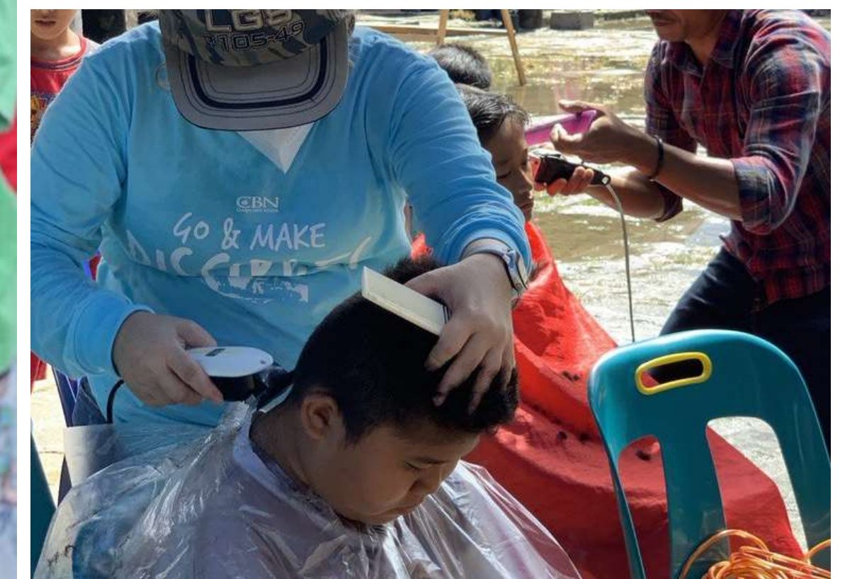
Pelayanan Potong Rambut Gratis