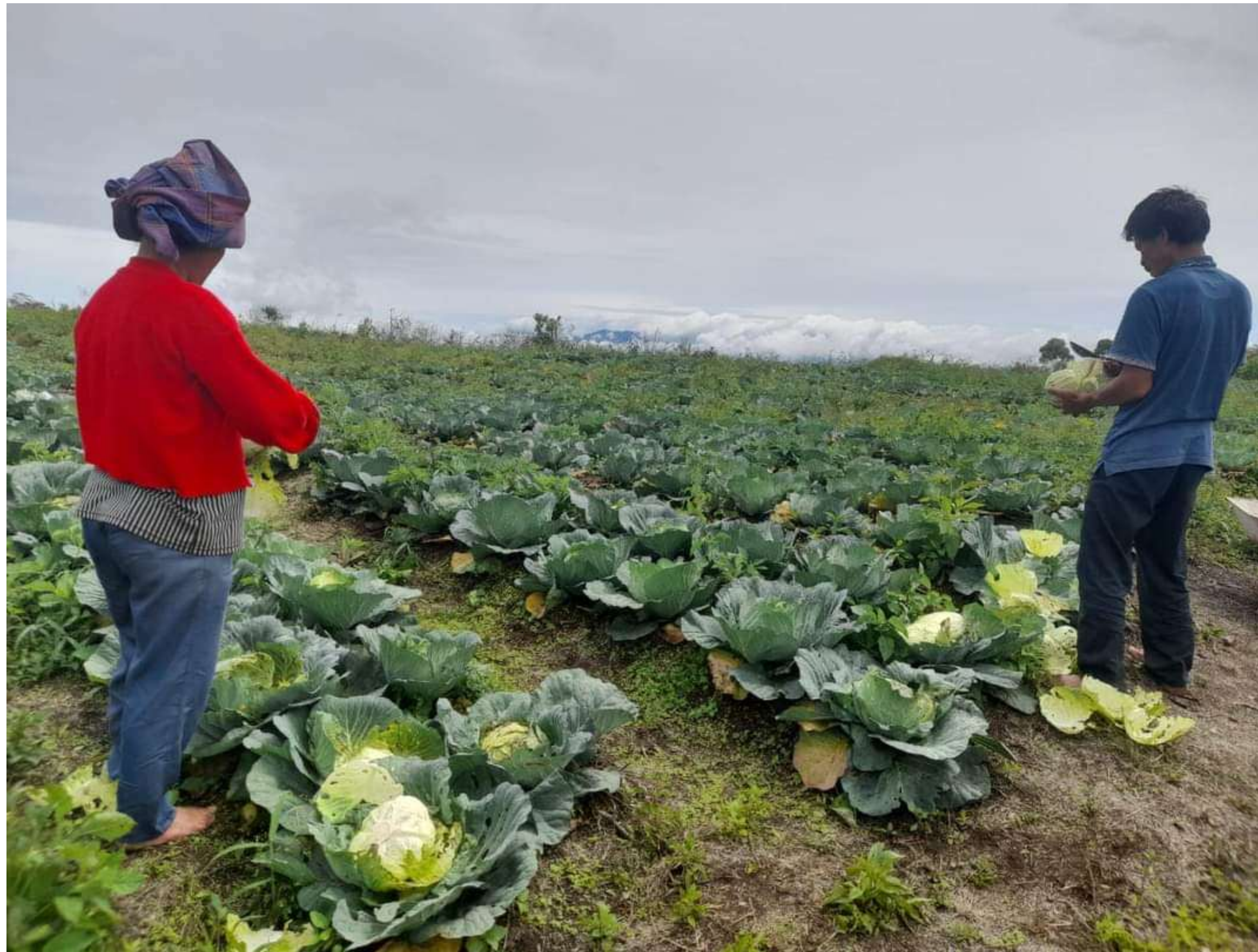
Ladang Kol di komunitas GPMI Eirene