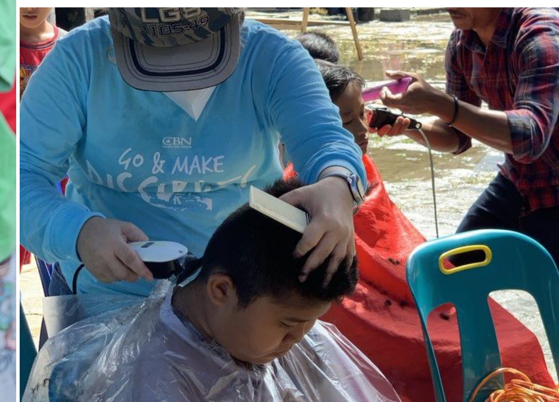
Pelayanan Potong Rambut Gratis