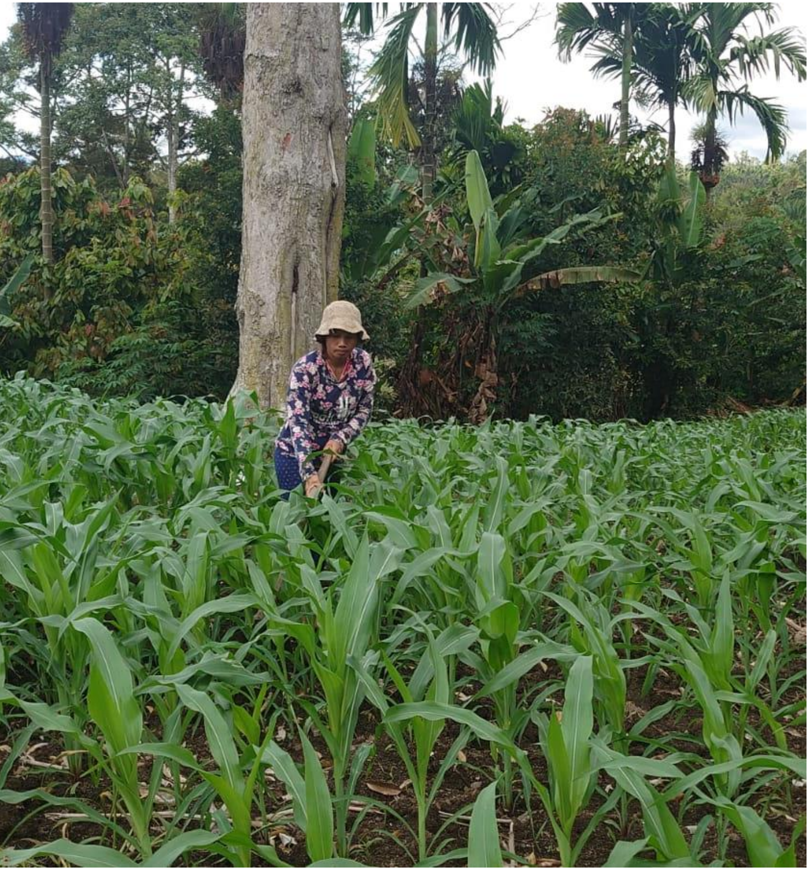
Ladang Jagung di komunitas GKGD Sidikalang