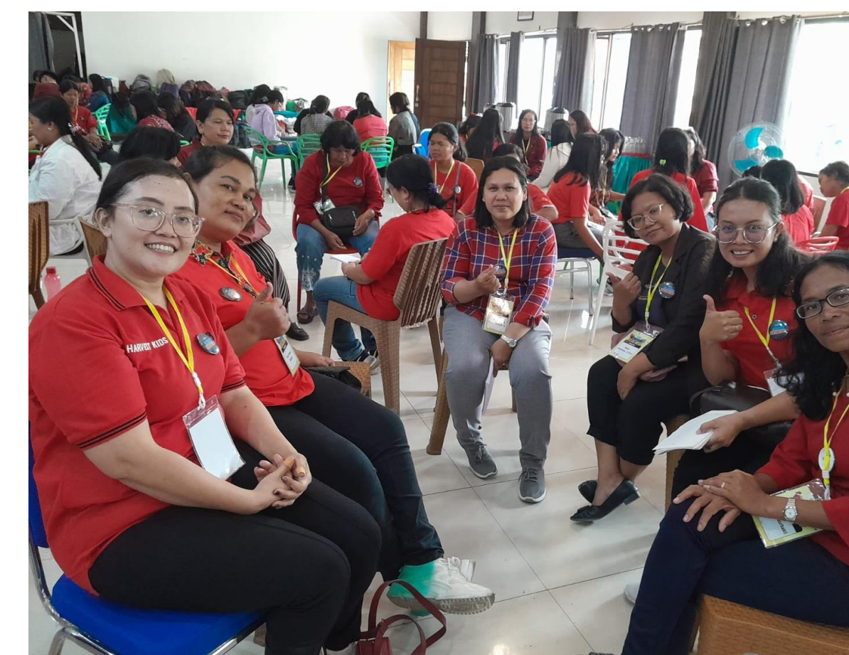
Suasana di ret-ret Pelayan Anak "Superteacher"