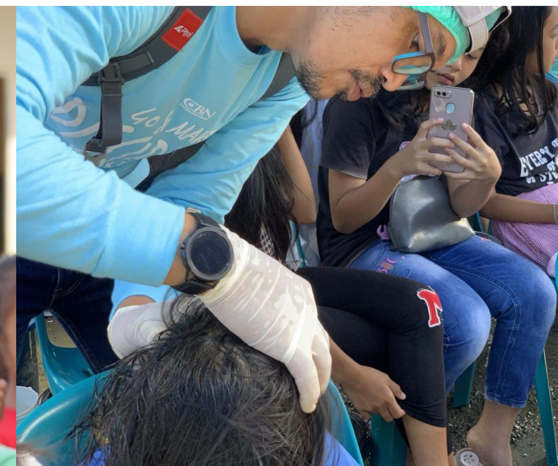
Pemberian Obat Kutu Rambut