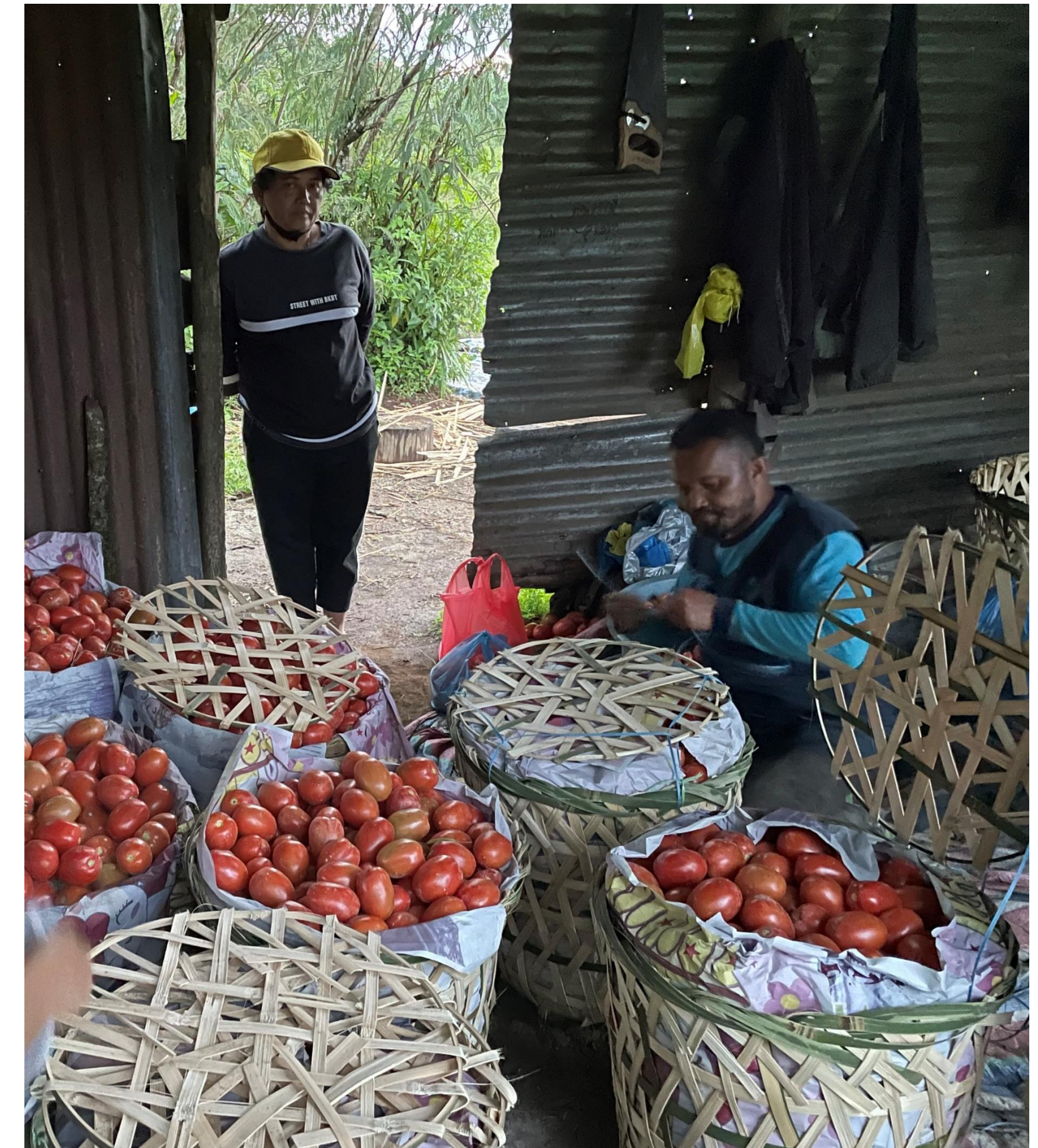
Hasil Panen Tomat dari komunitas GPMI Eirene