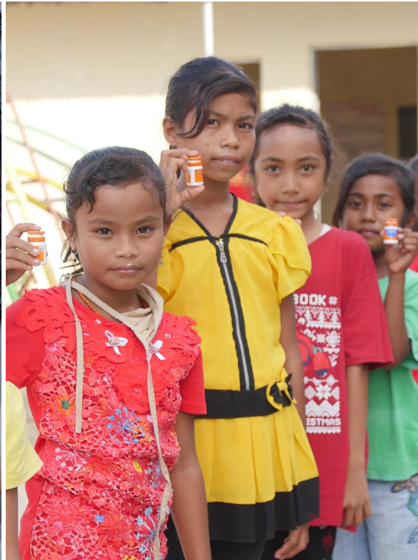
Baksos Kesehatan Gratis