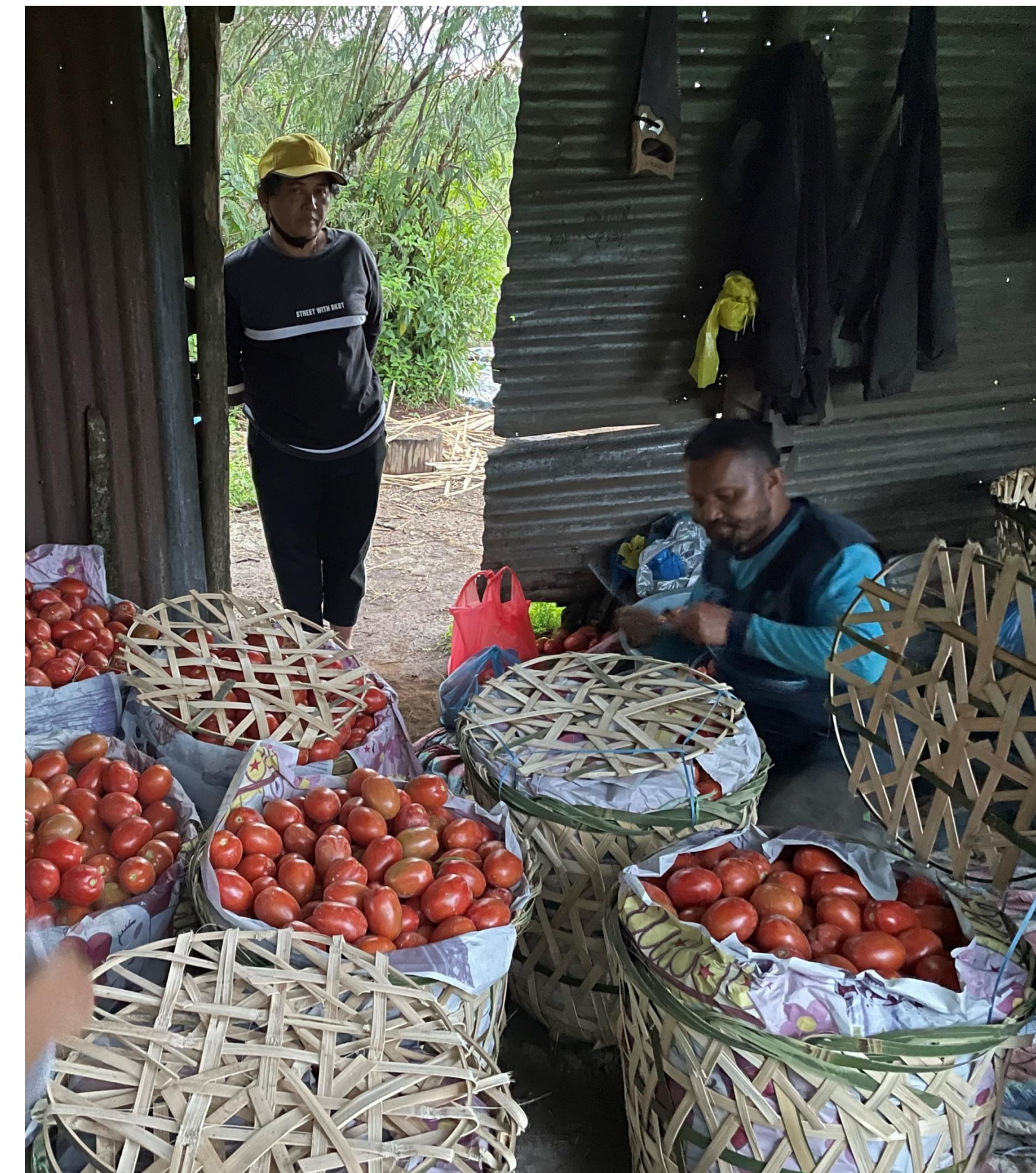
Hasil Panen Tomat dari komunitas GPMI Eirene