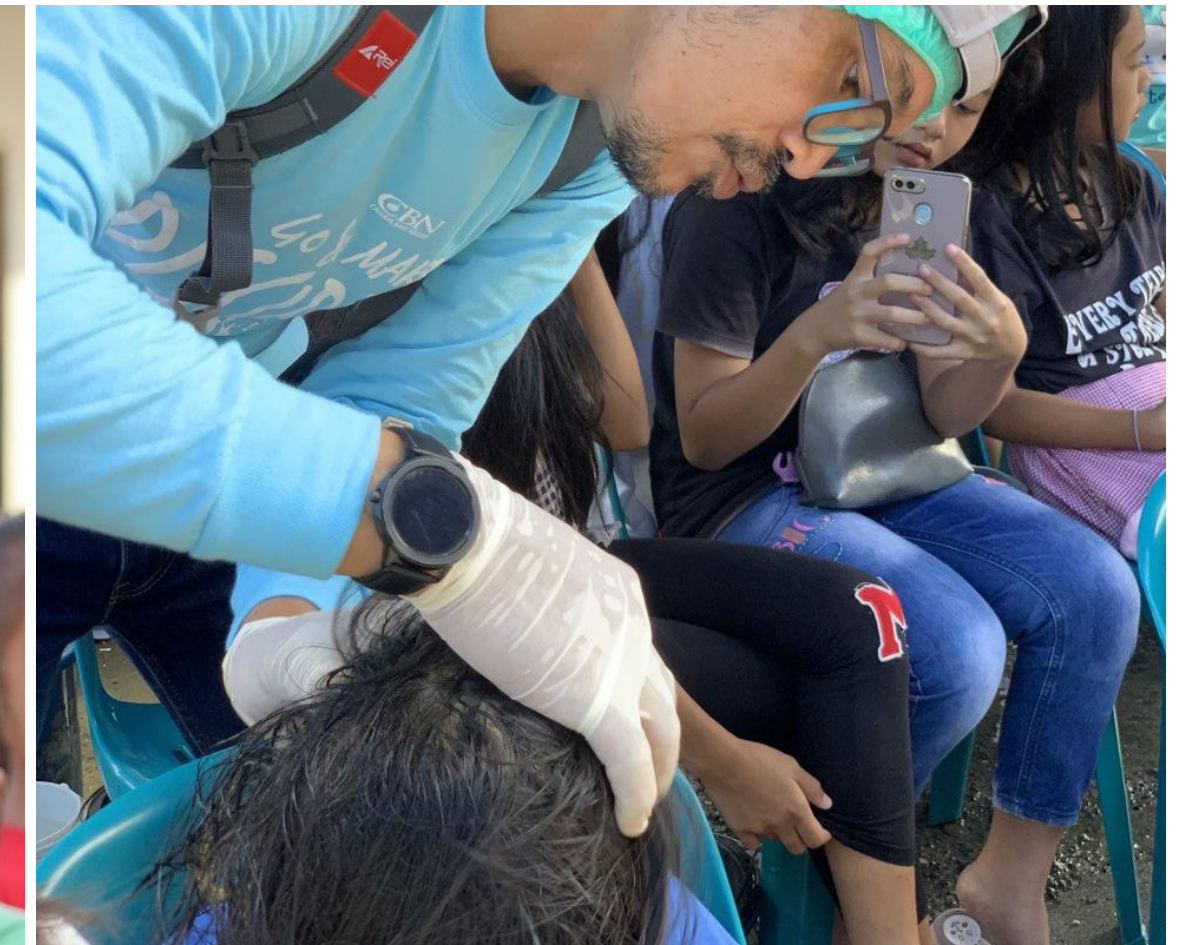
Pemberian Obat Kutu Rambut