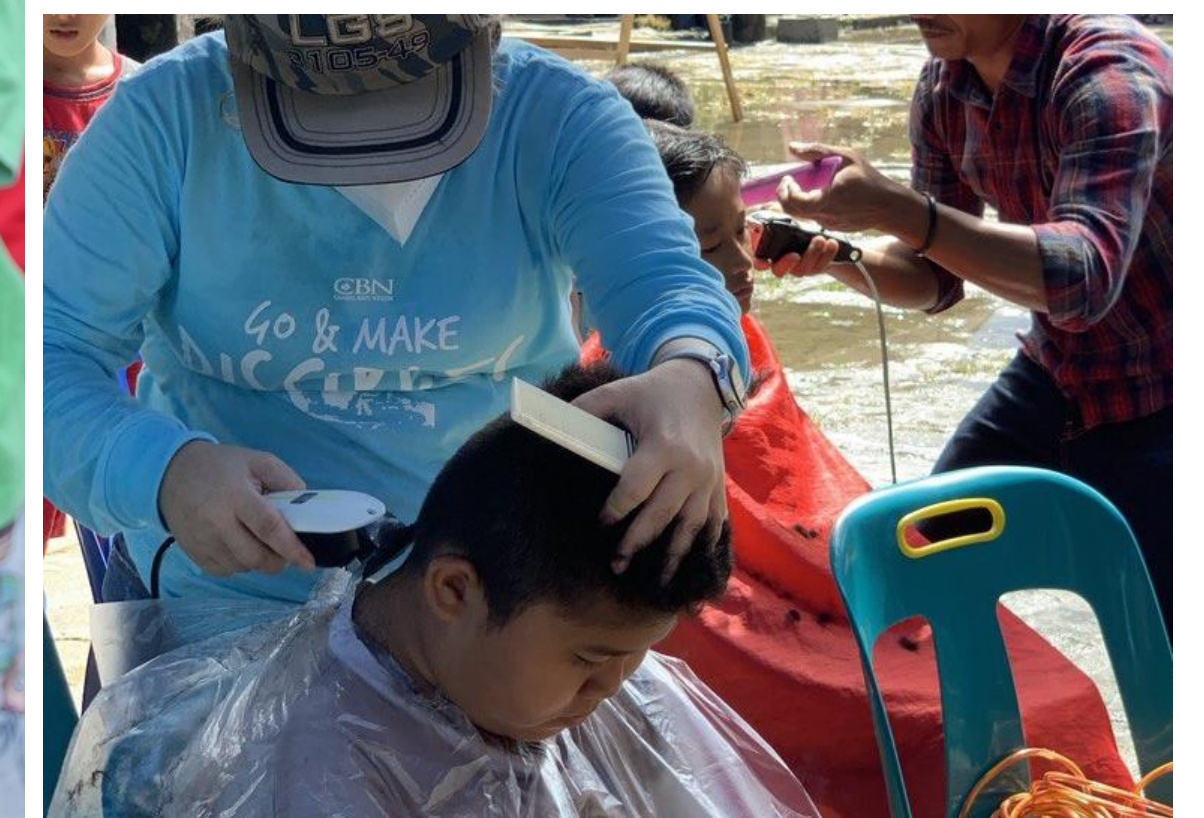
Pelayanan Potong Rambut Gratis