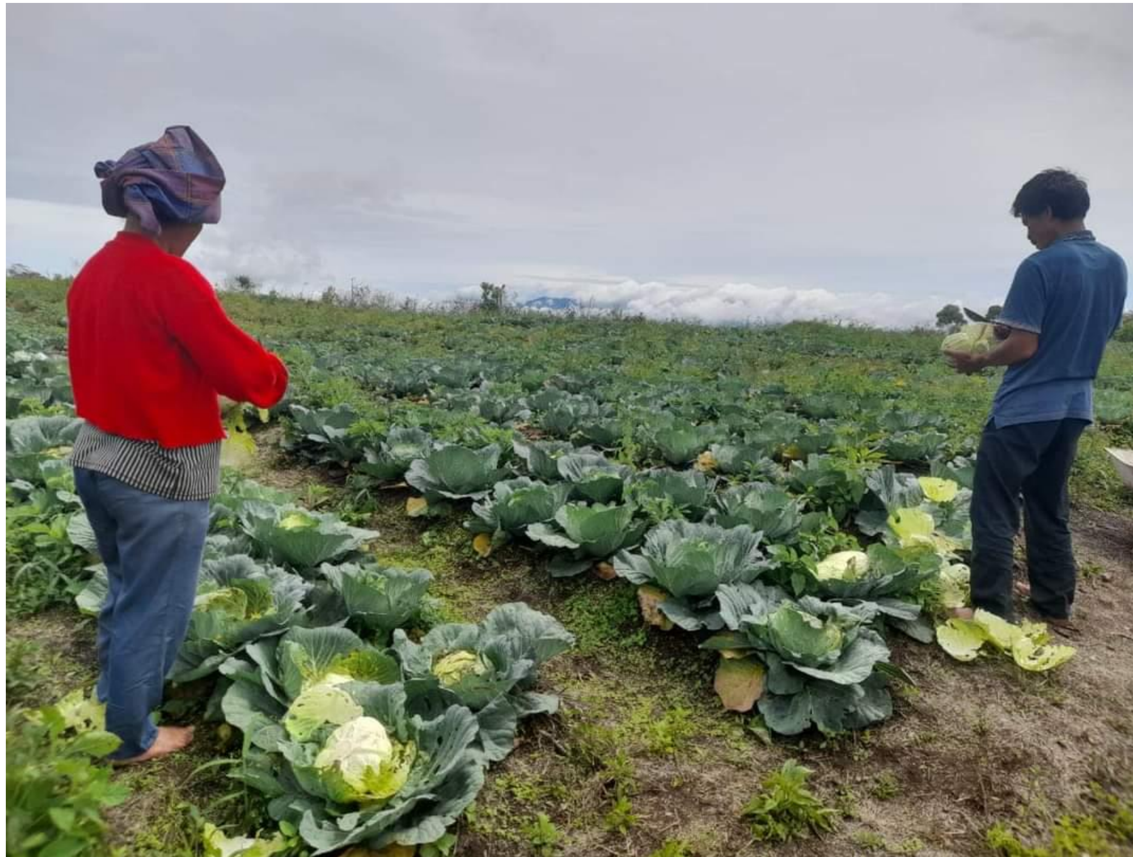
Ladang Kol di komunitas GPMI Eirene