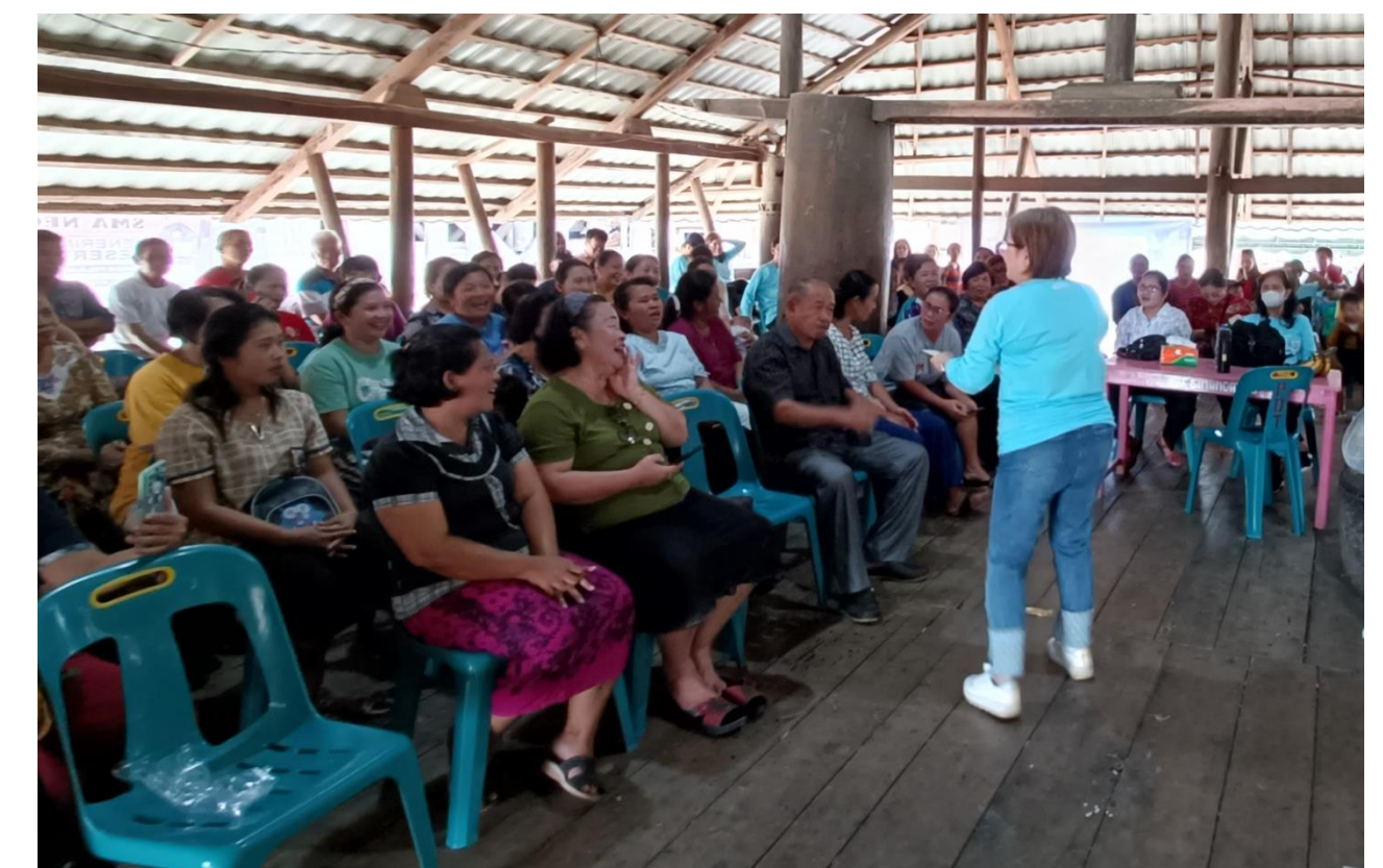
Penyuluhan parenting yang baik kepada orang tua murid dalam komunitas