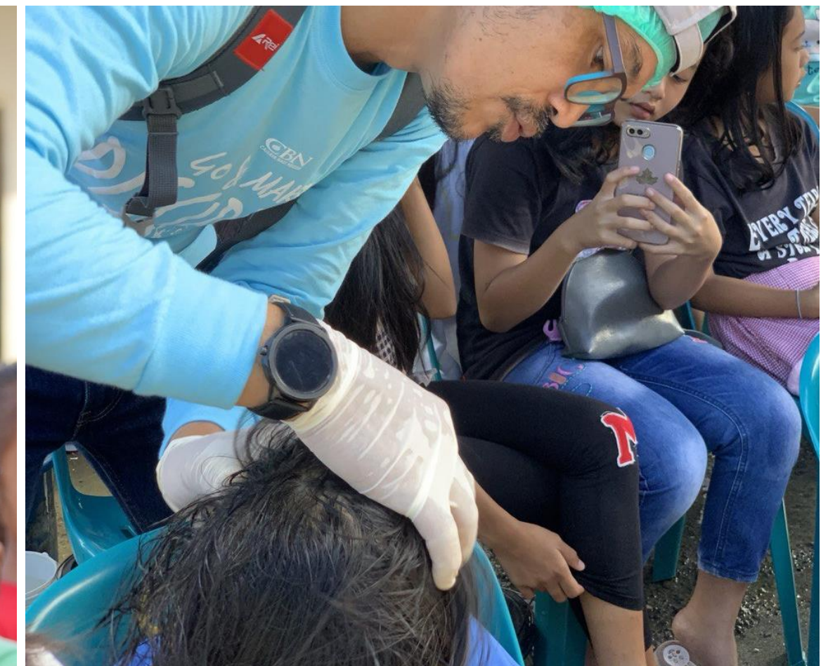
Pemberian Obat Kutu Rambut