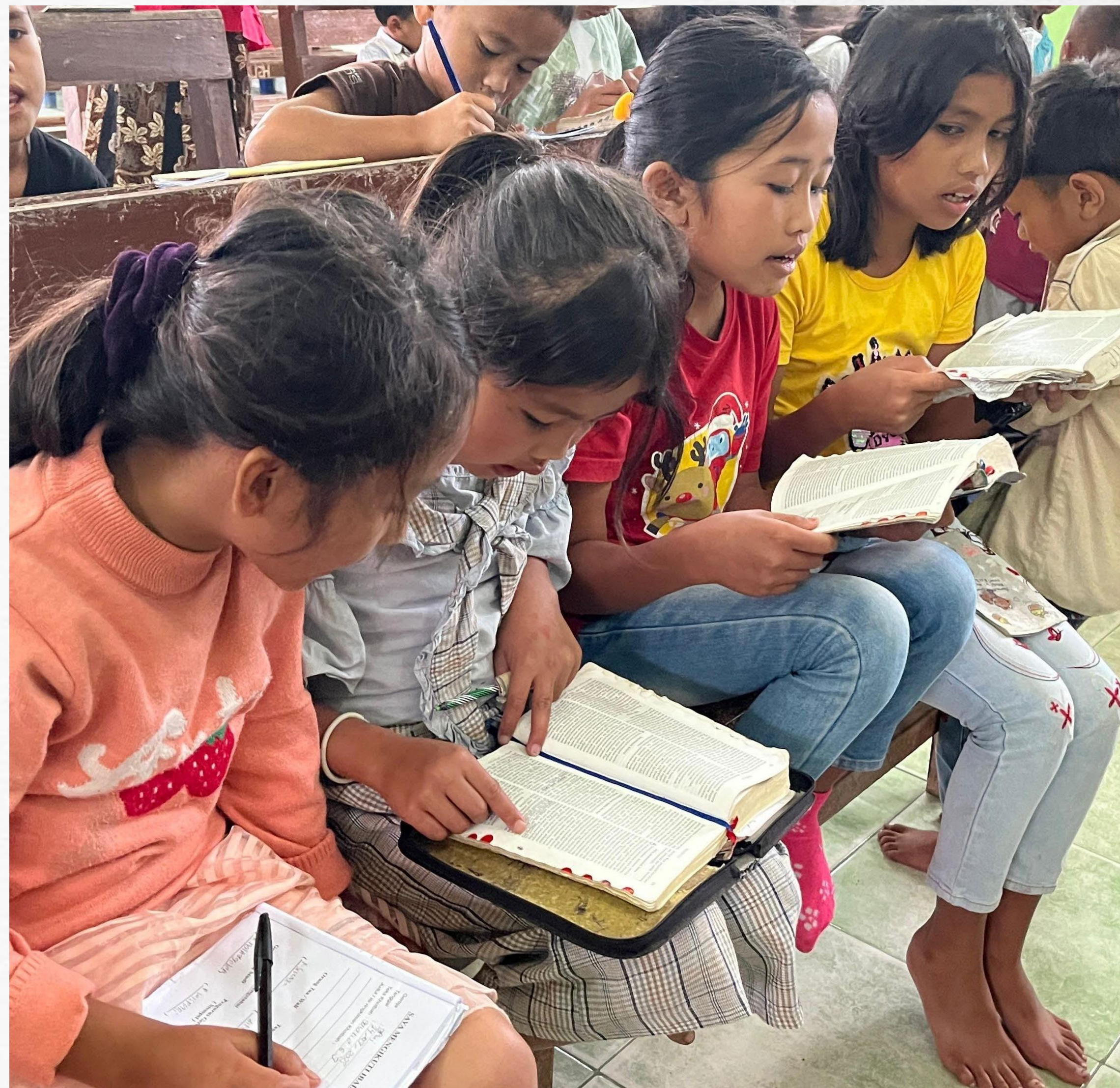
Anak – Anak Belajar Firman Tuhan di komunitas GPMI Eirena