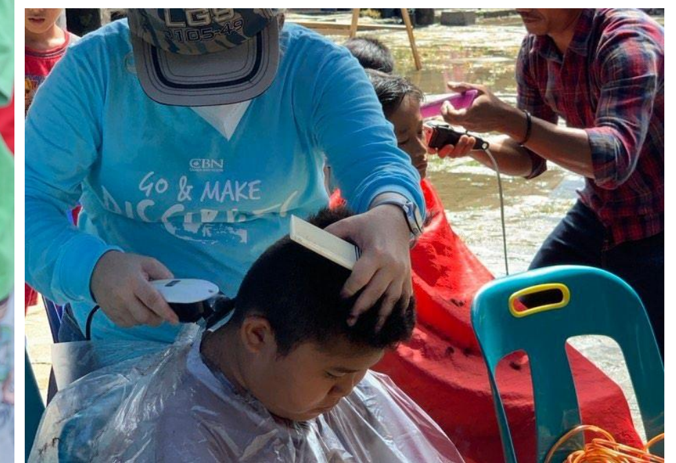
Pelayanan Potong Rambut Gratis