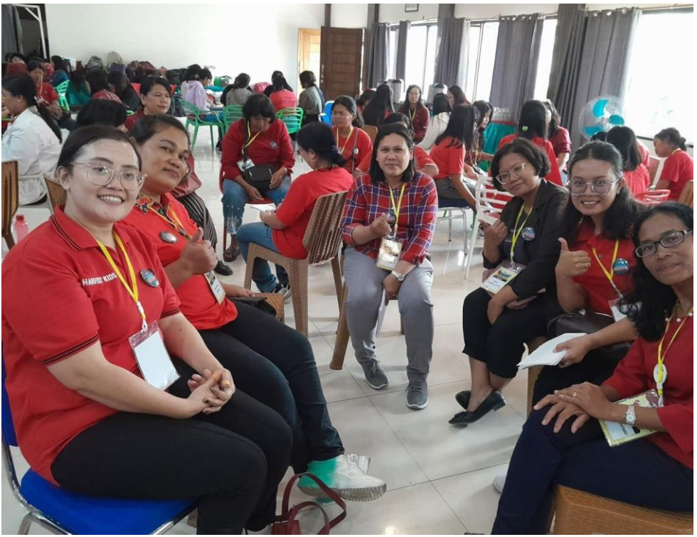
Suasana di ret-ret Pelayan Anak "Superteacher"