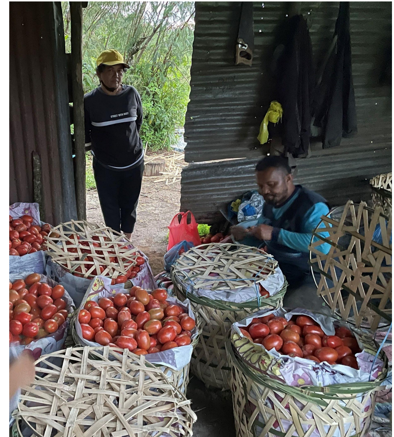
Hasil Panen Tomat dari komunitas GPMI Eirene