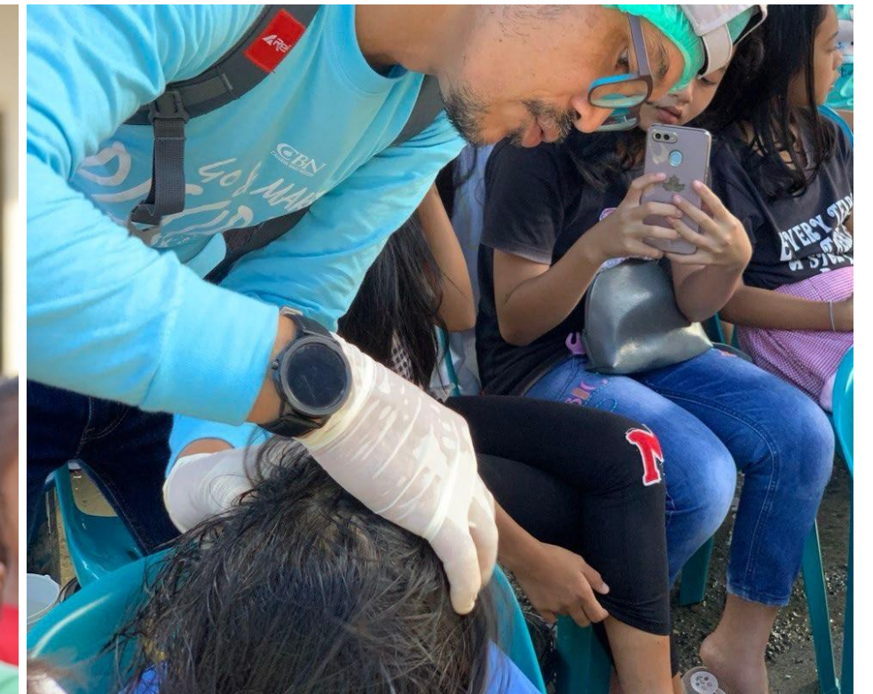
Pemberian Obat Kutu Rambut