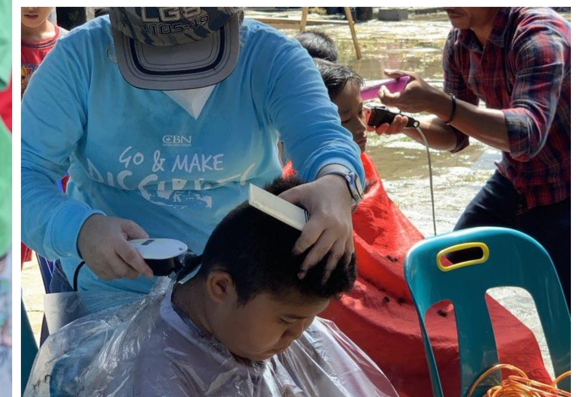
Pelayanan Potong Rambut Gratis