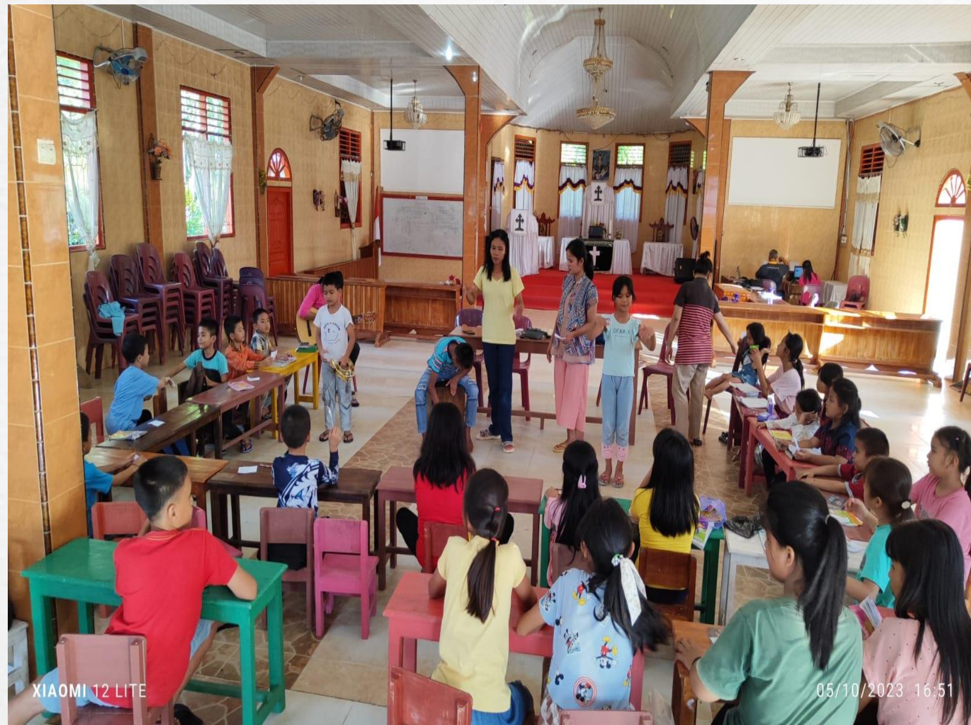
Anak – anak di AFY Tetelesi Amandraya Nias